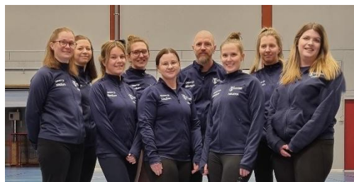
Några av våra ledare 2025